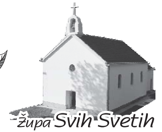
župa Svih Svetih